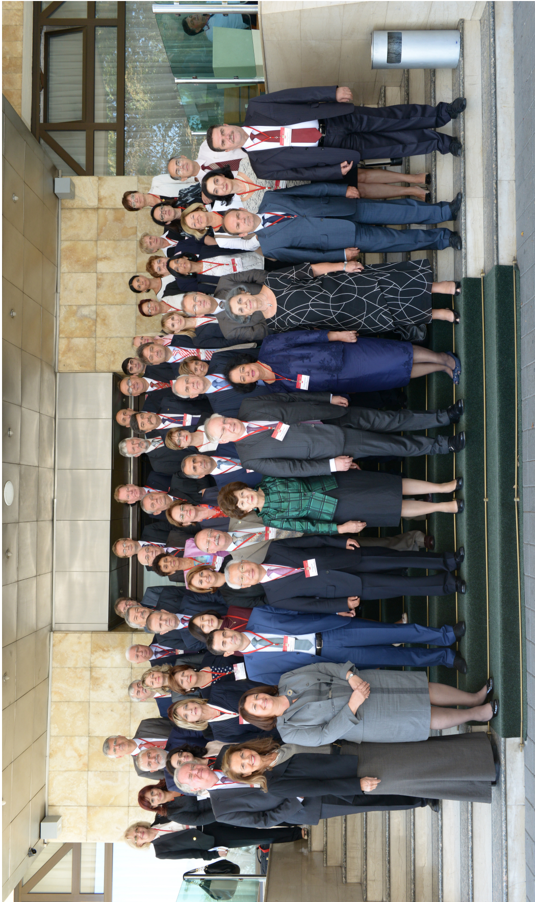
50-Годишнина од уставното судство во Република Македонија – Групна фотографија со учесниците на Меѓународната конференција