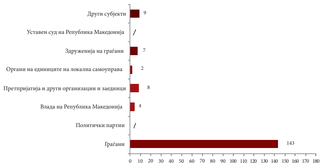
Подносители на иницијативи